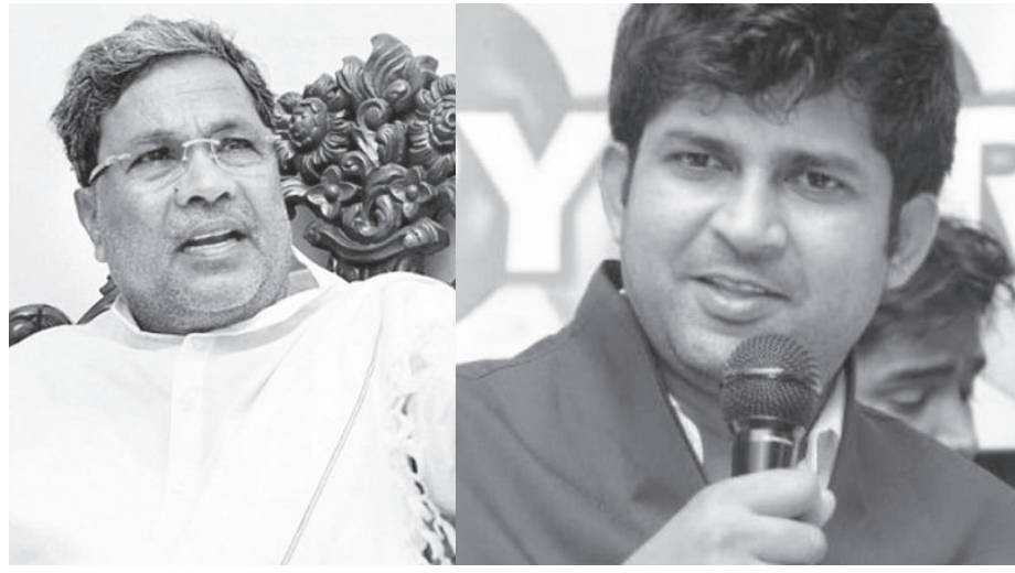
ಅಮಿತ್ ಷಾ ಅವರು ಬೆಂಗಳೂರಿಗೆ ಬಂದು ಹೋದ ನಂತರ ಅವರಿಂದ ನಾವು ಏನೂ ಪಾಠ ಕಲಿಯುವ ಆಗತ್ಯವಿಲ್ಲ ಅಂತಾರೆ ಸಿಎಂ. ಜೈಲಿಗೆ ಹೋಗಿ ಬಂದವರ ಬಳಿ ನಾವೂ ಪಾಠ ಕಲಿಯುವ ಆಗತ್ಯವಿಲ್ಲ ಅಂತಾರೆ. ಆದರೆ ದುರದೃಷ್ಟವಶಾತ್ ಅಂದರೆ ಕೋರ್ಟ್ ನಿಂದಲೇ ದೂಷಿ ಅಂತ ತೀರ್ಮಾನ ಆಗಿತ್ತು. ದೇಶದ ಮೊದಲ ಮಹಿಳಾ ಪ್ರಧಾನಿಯನ್ನು ದೂಷಿ ಎಂದಿದ್ದು, ಚುನಾವಣೆಯಲ್ಲಿ ಅಕ್ರಮ ಎಸಗಿದ್ದು ಅಂತ ಜೈಲಿಗೆ ಹೋಗಿದ್ದು, ಅಂತವರ ಘೋಷೋ ಇಟ್ಟಿದ್ದು ಇಂದಿರಾ ಕಾಂಟೋನ್ ಮಾರ್ಡ್. ದೇಶದಲ್ಲಿ ತುರ್ತುಪರಿಸ್ಥಿತಿ ಹೇರಿ ಪ್ರಜಾಪ್ರಭುತ್ವದ ಕಗ್ಗೂಲೆ ಮಾಡಿದ್ದರು. ಇಂತವರನ್ನು ಆರಾಧಿಸುತ್ತಿರುವ ಕಾಂಗ್ರೆಸ್ ನವರು ನಮ್ಮ ಬಗ್ಗೆ ಮಾತನಾಡುವ ನೈತಿಕತೆ ಇಲ್ಲ

ಮೈಸೂರು: ಬಿಜೆಪಿ ರಾಜ್ಯಾಧ್ಯಕ್ಷ ಅಮಿತ್ ಷಾ, ಪ್ರಧಾನಿ ನರೇಂದ್ರ ಮೋದಿ, ಬಿಜೆಪಿ ರಾಜ್ಯಾಧ್ಯಕ್ಷ ಯಡಿಯೂರಪ್ಪ ಈ ಮೂವರು ತ್ರಿಮೂರ್ತಿಗಳ ಮುಂದೆ ಸಿದ್ದರಾಮಯ್ಯ ಆಟ ನಡೆಯುವುದಿಲ್ಲ ಎಂದು ಸರ್ಕಾರದ ವಿರುದ್ಧ ಮೈಸೂರು ಕೊಡಗು ಸಂಸದ ಪ್ರತಾಪ್ ಸಿಂಹ ವಾಗ್ದಾಳಿ ನಡೆಸಿದರು.