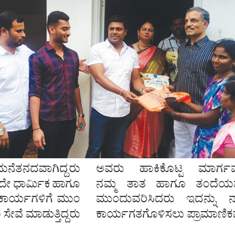
ಗ್ರಾಮದಲ್ಲಿ ದೊಡ್ಡಮನೆತನದವಾಗಿದ್ದು ಗ್ರಾಮದಲ್ಲಿಯೇ ಯಾವುದೇ ಧಾರ್ಮಿಕ ಹಾಗೂ ಸಾಮಾಜಿಕ ಸೇವಾಕಾರ್ಯಗಳಿಗೆ ಮುಂಚೂಣಿಯಾಗಿ ನಿಂತು ಸೇವೆ ಮಾಡುತ್ತಿದ್ದರು