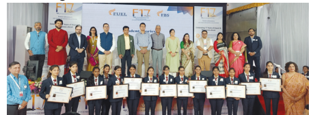
ಬೆಂಗಳೂರು: ಕೌಶಲ್ಯ ತಿಕ್ಕಣ, ವ್ಯಕ್ತಿತ್ವ ತರಬೇತಿ ಮತ್ತು ಉದ್ಯೋಗದ ಬೆಂಬಲದ ಮೂಲಕ ಸಮಾಜದ ಹಿಂದುಳಿದ ಸಮುದಾಯದ ಯುವಕರನ್ನು ಸಬಲೀಕರಣಗೊಳಿಸಲು ಮೀಸಲಾಗುವ ಉತ್ತರಾಂಶ ಸಂಸ್ಥೆ ಪ್ರಯತ್ನ (ಪ್ರಾಂತ್ಯ ಯೂನಿವರ್ಸಿಟಿ ಫಾರ್ ಅಭಿವೃದ್ಧಿ ಕೌನ್ಸಿಲ್ ಲೈವ್) 17ನೇ ಸಂಸ್ಥಾಪನಾ ದಿನವನ್ನು ಅರ್ಥಪೂರ್ಣವಾಗಿ ಆಚರಿಸಿತು. ಈ ವಿಶೇಷ ದಿನದಂದು 90 ಐದು ವಿದ್ಯಾರ್ಥಿನಿಯರಿಗೆ ವಿದ್ಯಾರ್ಥಿವೇತನ ವನ್ನು ವಿತರಿಸುವ ಮೂಲಕ ಪ್ರಯತ್ನ ಇಂಟರ್ನಲ್ ಜನರ ಜೀವನವನ್ನು ಸುಧಾರಿಸುವ ತನ್ನ ಬುದ್ಧಿಶಕ್ತಿಯನ್ನು ಪುನರುಚ್ಚರಿಸಿತು.